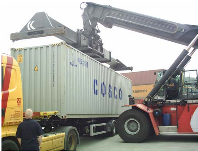
Laden mit einem Spreader ist natürlich auch möglich