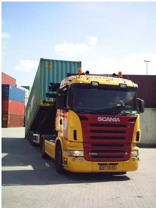
Der Fahrer kontrolliert die Aufnahme von der Kabine aus